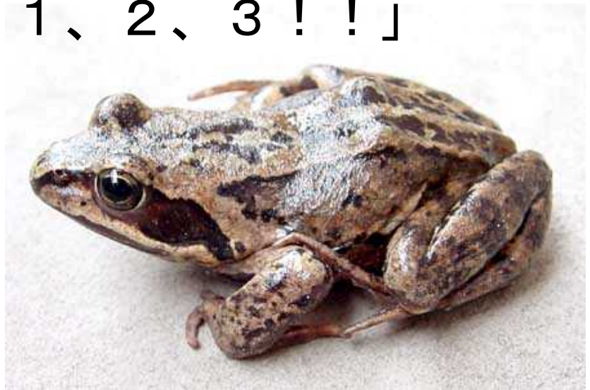
↑エゾアカガエル（滝野にもすんでいるよ）